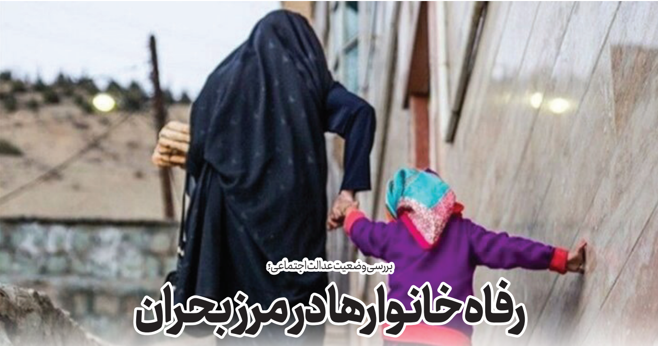
بررسی وضعیت عدالت اجتماعی