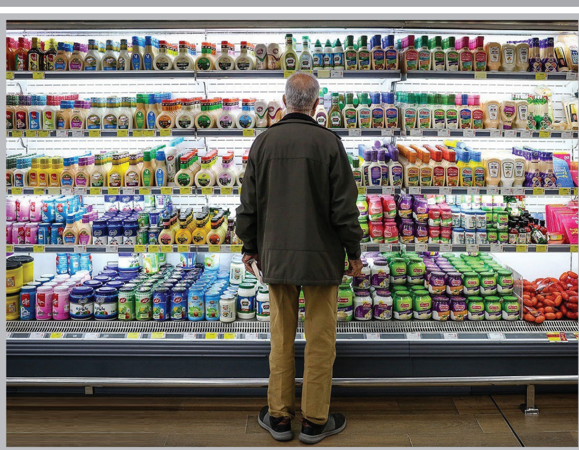
برآورد سبد حداقل هزینه خوراکی هریرانی؛