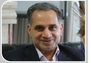
بازرس کل قضایی استان کرمان:

پرداخت سهم ۱۵ درصدی کرمان از عوارض معادن، تکلیف دولت است