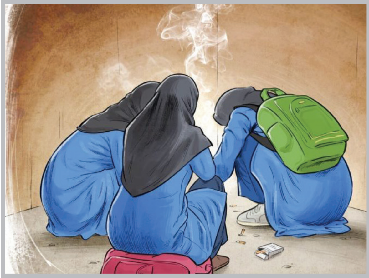
افزایش آسیب‌های اجتماعی در کشور: