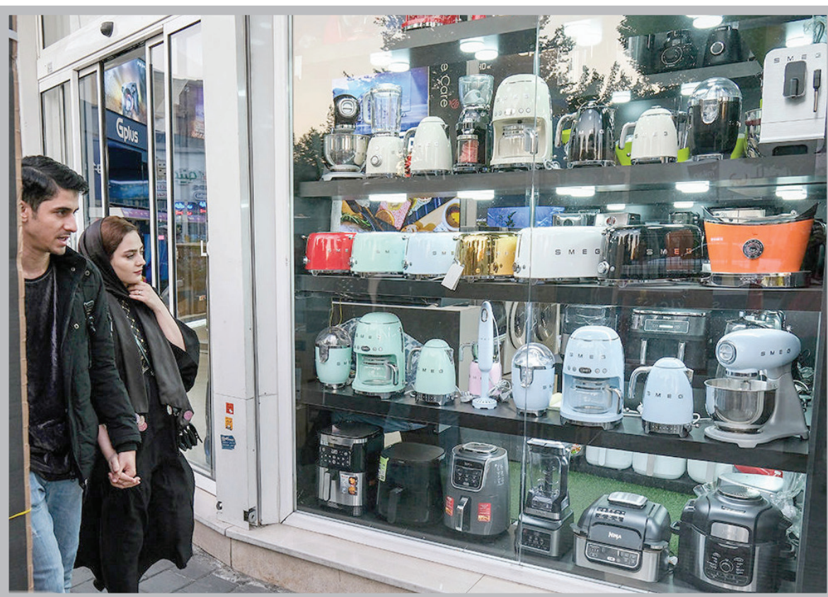
نظارت غیرکاری اتحادیه های صنفی کرمان را رکورددار تورم سالانه کرد