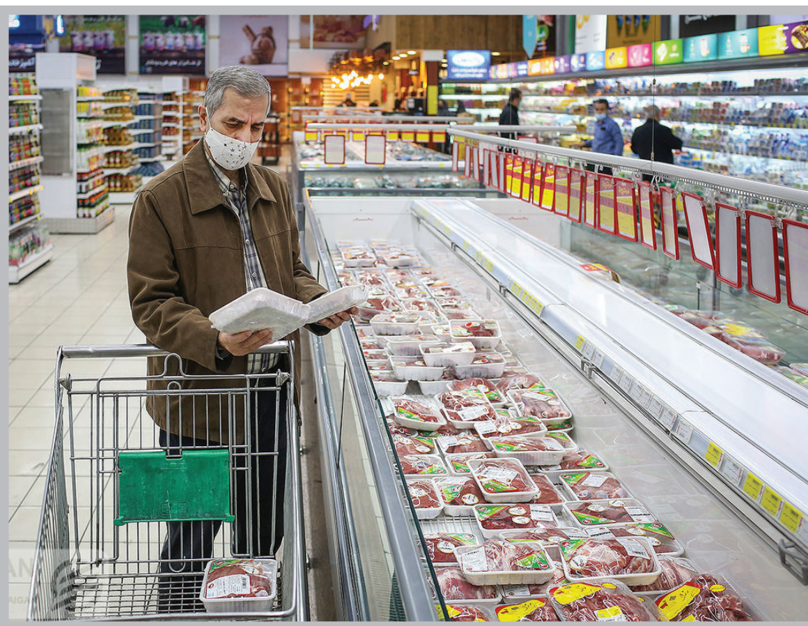
سهم اقلام خوراکی و غیر خوراکی از تورم ماهانه دهک ها؛