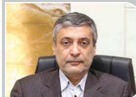
رئیس اتاق کرمان؛