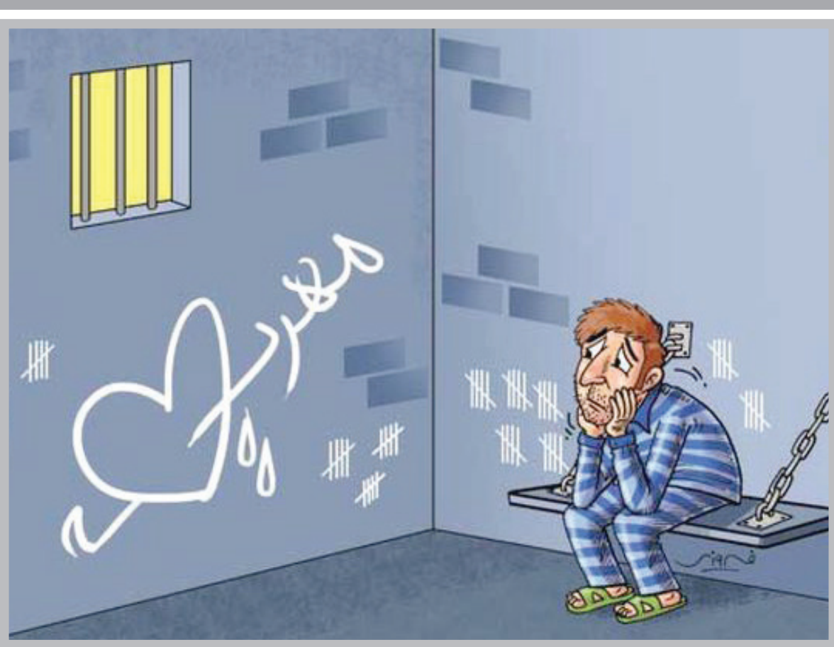
مدیر ستاد دیده هشدار داد: