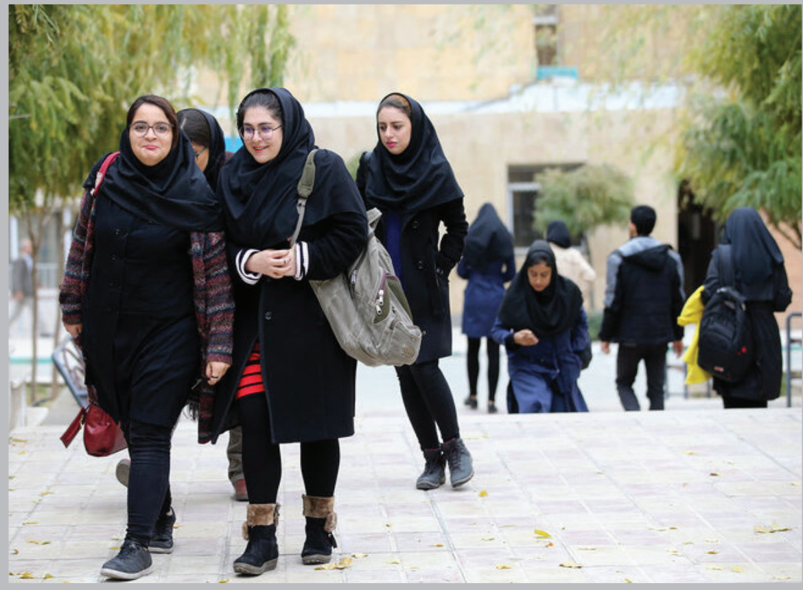
رئیس مرکز تحقیقات سالمندی دانشگاه علوم توان بخشی و سلامت اجتماعی خیرداد: