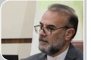
شهردار کرمان خبر داد:

تأمین اجتماعی حق قطع بیمه کارگران برای وصول مطالباتش را ندارد