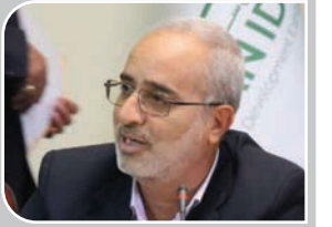
استاندار کرمان مطرح کرد:

تأمین اجتماعی حق قطع بیمه کارگران برای وصول مطالباتش را ندارد