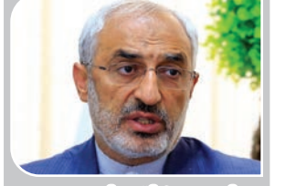
زاهدی در نطق میان دستور: