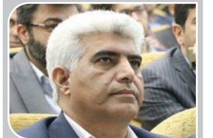
مدیرکل بنیاد مسکن استان کرمان: