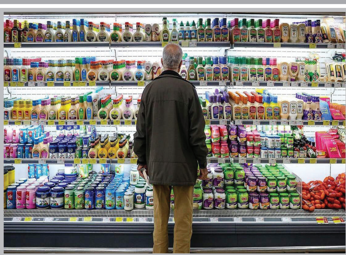
تورم ماهانه به تفکیک هر استان در اسفند ۱۴۰۲: