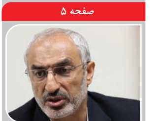
زاهدی نماینده کرمان و راوور در تذکر شفاهی خواستار شد؛