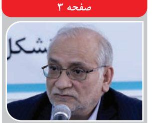
یادداشت سیدحسین مرعشی به مناسبت سالگرد آیت الله هاشمی رفسنجانی؛