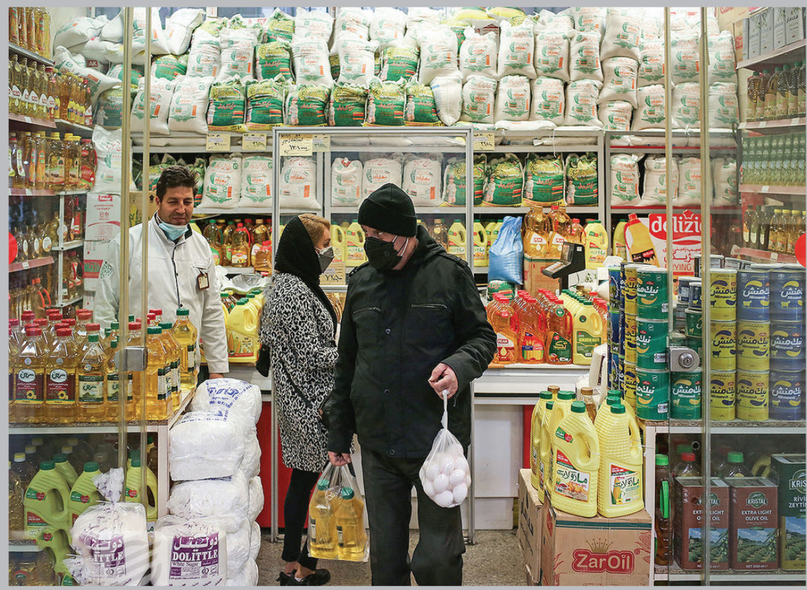
توزیع تورم ماهانه در بین دهک‌ها چگونه بود؟