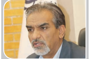
مدیرکل بهزیستی استان؛