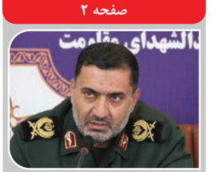
با آغاز هفته مقاومت؛