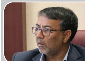
مدیرعامل شرکت گاز استان عنوان کرد؛