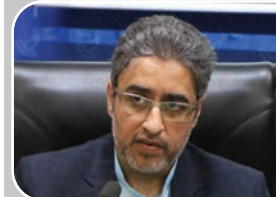
وعدی مدیرکل ارتباطات استان کرمان؛

با اجرای طرح ملی فیبر نوری سرعت اینترنت ۸۰ برابر می شود