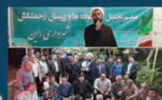
تجلیل از خانواده ها و پرسنل زحمتکش شهرداری