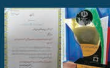
انتخاب شهرداری راین بعنوان شهرداری برتر استان کرمان در حوزه عمرانی

امیدواریم به لطف خداوند متعال و دعای خیر شما شهروندان نجیب، با برنامه ریزی های انجام شده و راه اندازی پروژه های درآمد زای شهرداری راین اقدامات عمرانی وسیعتری صورت پذیرد و این شهر تاریخی آرمیده بر دامنه کوه هزار به جایگاه اصلی خود، نزدیک شود.