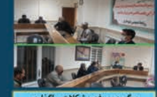
پیگیری و رفع مشکلات و انگذاری زمین های شهرک شهرداری بعد از ۳۰ سال