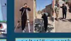
بازدید مستمر، نقشه برداری و نظارت پروژه ها توسط شهردار راین