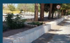
جدول گذاری خیابان ها