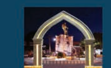
باز طراحی و بازسازی میدان انقلاب