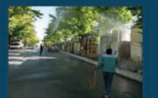
سهمایشی درختان سطح شهر به صورت مستمر