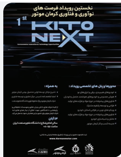
همزمان با برپایی نخستین رویداد فرصت های نوآوری و فناوری کرمان موتور، نخستین رویداد

فرصت های نوآوری و فناوری کرمان موتور با عنوان KITO NEXT در روز یکشنبه ۱۴ آبان ماه جاری، در دانشگاه علم و صنعت ایران برگزار خواهد شد. مهمترین محورهای پیل های تخصصی این رویداد، شامل "خودروه های هیبریدی، برقی و انرژی های نو"، "هوش مصنوعی و خودروه های هوشمند متصل و خودران"، "فناوری های پیشرفته در حوزه مواد و فرایندهای تولید"، "طراحی و توسعه پلتفرم مشترک"، "رویکردهای نوین در طراحی استایل خودرو"، "تحلیل و شبیه سازی خودرو" و "مدرسه کسب و کار کرمان موتور" می باشد. همچنین قرار است تا در این رویداد فرصت های نوآوری و فناوری، و مراحل توسعه اولین محصول بومی کرمان موتور تشریح شود و نسبت به تاسیس دفتر تحقیق و توسعه فناوری شرکت کرمان موتور در دانشگاه علم و صنعت اقدامات لازم صورت گیرد. دبیرخانه نخستین رویداد KITO NEXT از تمام شرکت های دانش بنیان، فناوری و موسسات