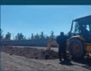
حفر کانال و لوله گذاری برای انتقال آب غیر شرب به فضای سبز