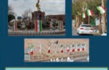
آذین بندی شهر در ایام جشن ها