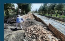
بازسازی پارک مادر