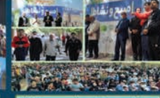
همکاری در برگزاری برنامه مسیح و نشاط بخش مستقیم از شبکه ۳ سیما