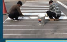
خط کشی ترافیکی