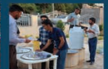
پذیرایی از شهروندان و گردشگران محترم به مناسبت اعیاد ملی و مذهبی