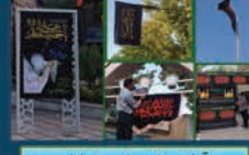
آماده سازی شهر در ایام سوگواری محرم و صفر