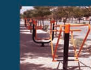
نصب تجهیزات ورزشی در پارک مادر و خیابان پاسداران