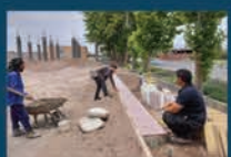
عملیات اجرایی احداث پارک طبیعت