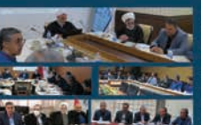
پیگیری مکاتبات شورا و شهرداری با مرکز استان توسط نماینده شورا در شورای شهرستان کرمان