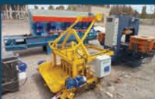
خرید دستگاه بلوک زن و موزائیک زن انومائیک با هدف کاهش هزینه ها در پروژه های عمرانی و افزایش درآمد پایدار برای شهرداری

امیدواریم به لطف خداوند متعال و دعای خیر شما شهروندان نجیب، با برنامه ریزی های انجام شده و راه اندازی پروژه های درآمد زای شهرداری راین اقدامات عمرانی وسیعتری صورت پذیرد و این شهر تاریخی آرمیده بر دامنه کوه هزار به جایگاه اصلی خود، نزدیک شود.