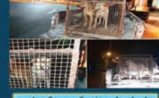
اجرای طرح زنده گیری سنگ های پلاصاحب به صورت مستمر