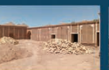
مرمت خانه تاریخی شهرداری