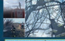
امرام خودرویی آتش نشانی به روستاهای اطراف در زمان خطر گسترش آتش در مراتع