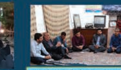
حضور مستمر شهردار و اعضای شورای شهر در جلسات مصلحت برای بررسی مسائل و مشکلات شهروندان