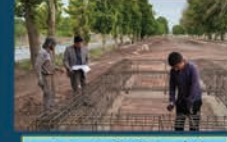
اجرای پروژه کوشک در مجموعه گردشگری در حال احداث پارک طبیعت