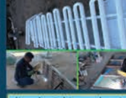
ساخت تجهیزات مورد نیاز توسط پرسنل فنی شهرداری با هدف کاهش هزینه ها