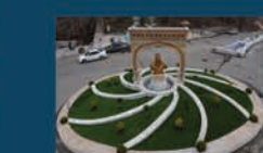
احداث میدان سردار دلها در ورودی شهر راین