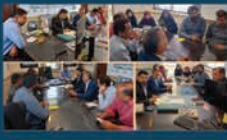
برگزاری جلسات شورای اداری به منظور هماهنگی برای انجام فعالیت های شهرداری