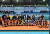
همکاری در برگزاری مسابقات ورزشی