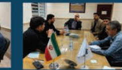
برگزاری منظم جلسات شورا برای بررسی طرح ها و مسائل مربوط به حوزه شهری راین