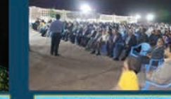
همکاری شهرداری و شورای شهر در برگزاری جشن ها