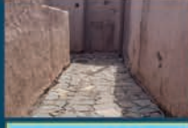
سنگ فرش معابر پیاده راه