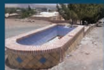
بازطراحی و نوسازی رفیوز ورودی بلوار ولیعصر