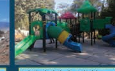
نصب وسایل بازی پلی اتیلن استاندارد در پارک های ولیعصر، مادر و ۹ دی