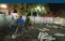
عملیات اجرایی بازسازی میدان آزادی