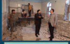
بازسازی گشتارگاه شهرداری