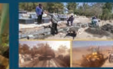
ساماندهی بهشت زهرا