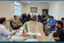
جلسات رئیس شورای شهر با شهروندان برای پیگیری و رفع مشکلات