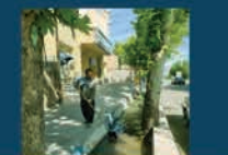
آبیاری درختان سطح شهر به صورت مستمر