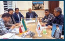
برگزاری جلسات اعضای شورای شهر و شهردار راین برای بررسی امور شهری