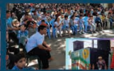
همکاری در اجرای برنامه های فرهنگی و هنری برای کودکان و نوجوانان