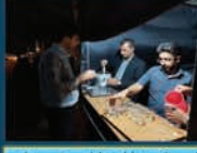
برپایی موبک در ایام عزاداری محرم و صفر برای پذیرایی از شهروندان و مسافران گرامی