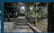
نوسازی و افزایش روشنایی پارک های سطح شهر