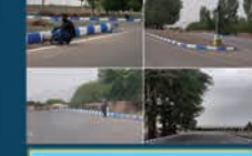
رنگ آمیزی جدول های معابر