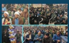
حضور شهردار و اعضای شورای شهر در مراسمات عمومی ملی و مذهبی