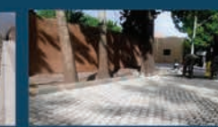
بهبودی بلوار گردشگری افلاطون