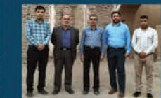
بازدید مستمر اعضای شورای شهر از پروژه های عمرانی و نظارت بر اجرای آنها