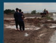
آماده باش و فعالیت پرسنل شهرداری در مواقع حوادث طبیعی