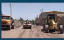
زیر سازی معابر