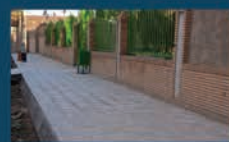
فرش موزائیک پیاده روها