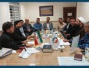
دعوت از مسئولین راین در جلسات شورای شهر برای بررسی مشکلات شهروندان