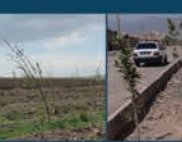
کاشت درخت چنار در سطح شهر و درختان میوه در باغ شهرداری