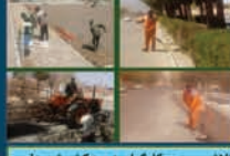
نمایش مستمر کارگران زحمتکش شهرداری برای نظیف معابر و اماکن عمومی