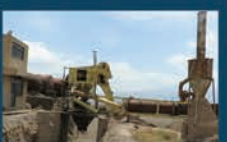
بازسازی و افزایش ظرفیت کارخانه آسفالت شهرداری