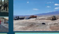
ساماندهی دفن اصولی زباله و اجرای لندفیل