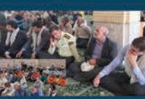
حضور مستمر در مراسم نماز جمعه