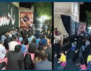
برگزاری مراسم عزاداری به مناسبت سوگواری ایام محرم و صفر