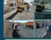
لکه گیری آسفالت معابر شهر