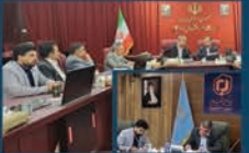
جلسات شهردار راین با مدیران کشوری در تهران و پیگیری مسائل حوزه شهری