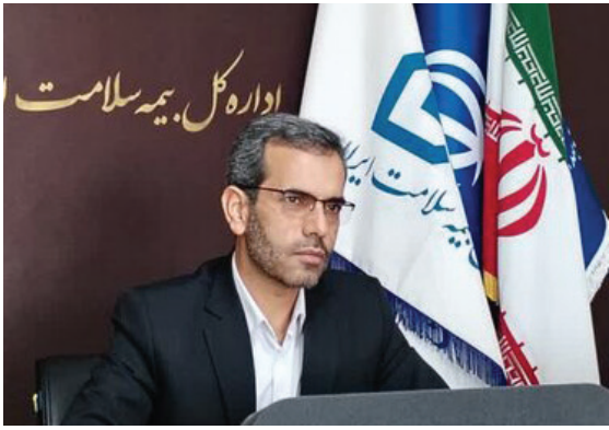
مدیرکل بیمه سلامت استان کرمان: