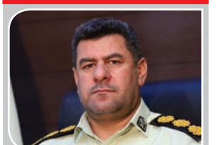
افزایش گشت های پلیس اطراف باغ های پسته؛