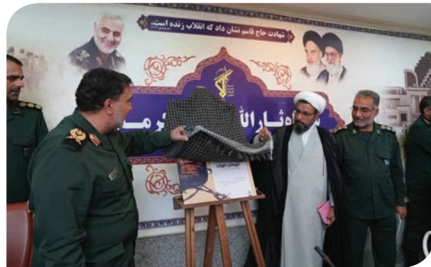
از مجموعه کمیک موشن «قهرمان مهران» با حضور فرمانده سپاه ثارالله استان رونمایی شد.

گفتنی است در دو بخش اول مجموعه کمیک موشن قهرمان مهران، به ماجرای فتح قلاویزان و عملیات فتح تپه شهدای سندانج به فرماندهی سردار شهید احمد شول پرداخته شده است.