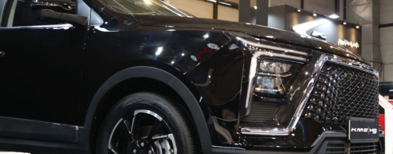
نسخه فیس لیفت چک S۵ پایشن های بیشتر