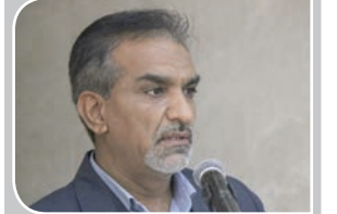
مدیرکل بهره‌یستی استان:

بدرپرستی و کودک‌آزاری بیشترین آسیب‌های اجتماعی کرمان است