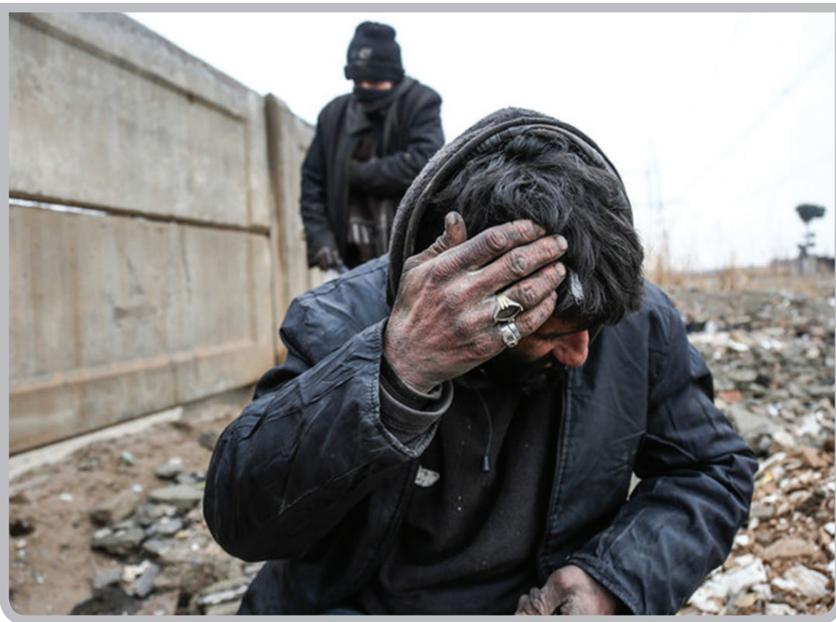
مدیرعامل سازمان ساماندهی مشاغل شهری شهرداری کرمان اعلام کرد