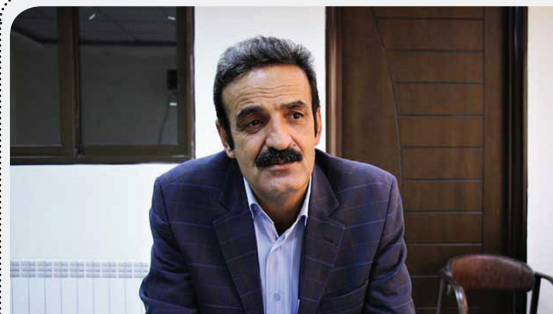
دبیر خانه کشاورز استان مطرح کرد:

مدیرعامل سازمان ساماندهی مشاغل شهری شهرداری کرمان با بیان اینکه شهرداری تنها یکی از ارکان مقابله با این قضیه است و دستگاه‌های متولی دیگری نیز در این حوزه نقش دارند، افزود: یک عزم فرادستگاهی