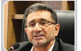
مدیرکل تعزیرات حکومتی کرمان عنوان کرد:

گرانی ها ناشی از تحریم و مدیریت نامناسب است