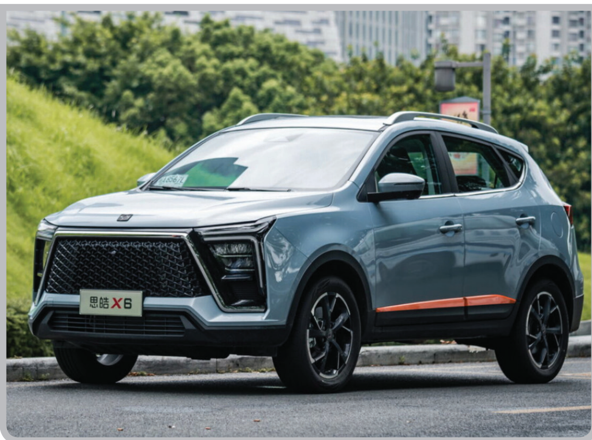
محصول جدید کرمان موتور بزودی عرضه می شود