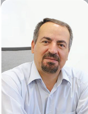
مجرى پروژه‌ی فلوتاسیون خاتون آباد خبر داد:

عده‌ای هنوز باور نمی‌کنند در تامین آب شرب مشکل داریم