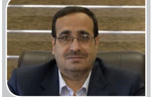
مدیرعامل آبقا کرمان مطرح کرد:

عده‌ای هنوز باور نمی‌کنند در تامین آب شرب مشکل داریم