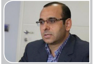
معاون تولید شرکت ملی صنایع مس ایران در نمایشگاه بین‌المللی معدن کرمان عنوان کرد:

سرمایه‌گذاری ۱۶ میلیارد دلاری برای توسعه صنعت مس