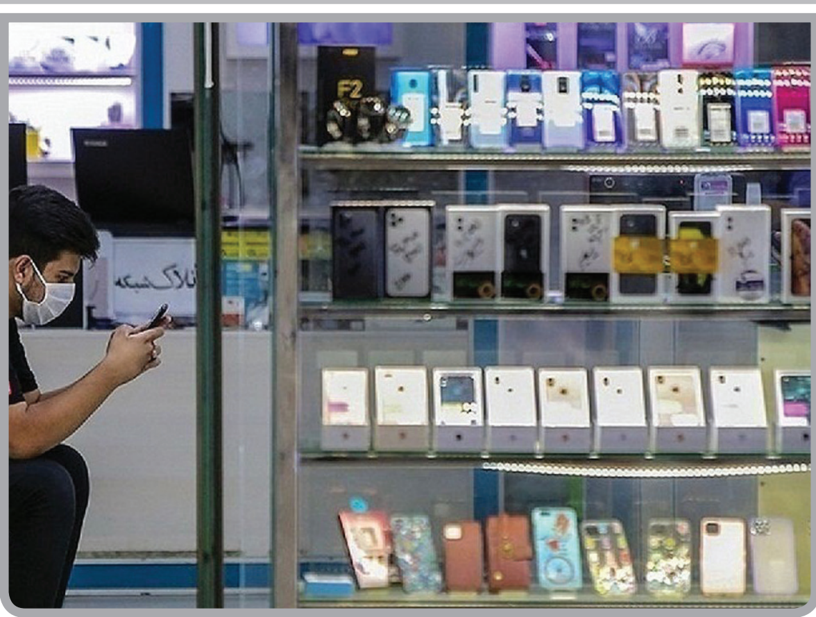
تبادل موبایل دست دوم و تعمیر گوشی